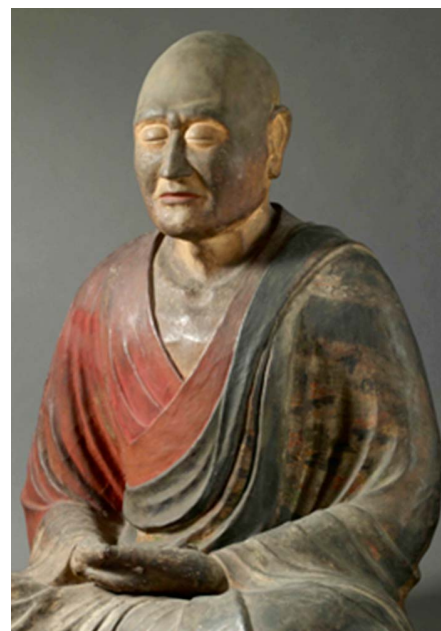
鑑真大和上(唐招提寺) ↑

鄧小平氏は鑑真和上の御廟(墓所)の前で非常に丁寧な仕草で鑑真和上に最上の敬意を示したという。